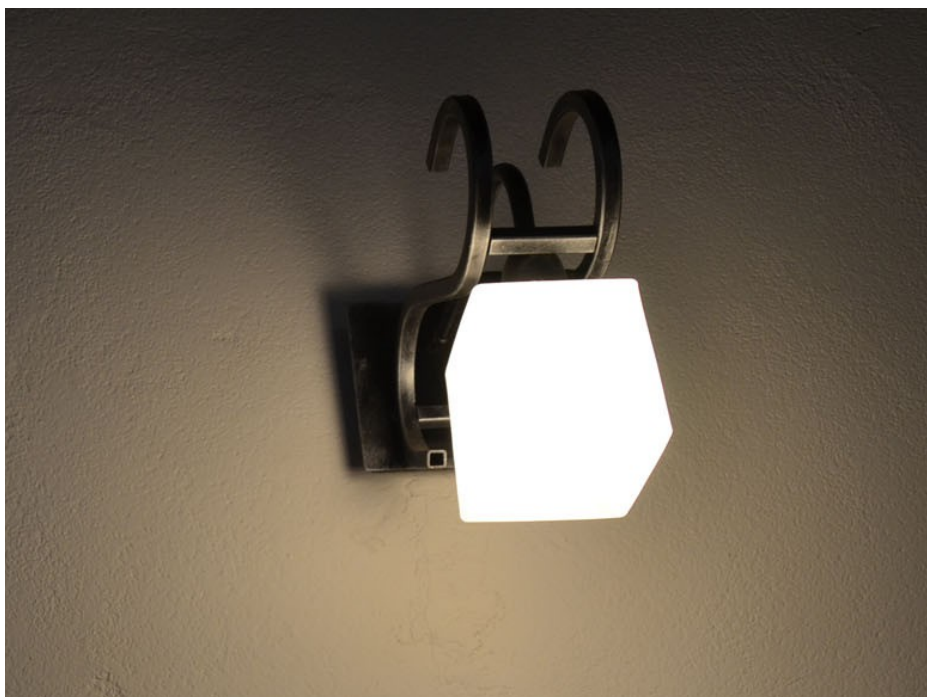
Fot. 2. – Lamy naścienne.

Oświetlenie awaryjne i ewakuacyjne pozostaje bez zmian.